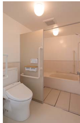
↑全室バス・トイレ付